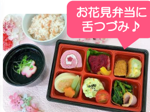
お花見弁当に舌つづみ♪

敷地内にはたくさんの桜の木が植わっており、見頃には圧巻の景色を楽しめます。花びらを手にとって笑顔になる方や、思い出話に花が咲くご夫婦もいらっしゃいました。